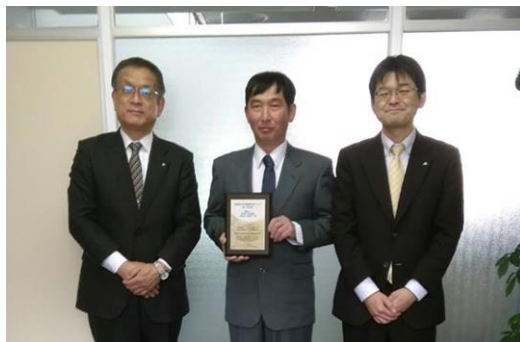
全国第 1 号案件を記念して楯を授与