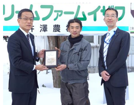
当組合お取引先で 2 件目。記念して楯を授与