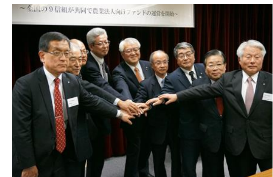
農業未来ファンド設立を発表し手を重ねる 9 信組の理事長